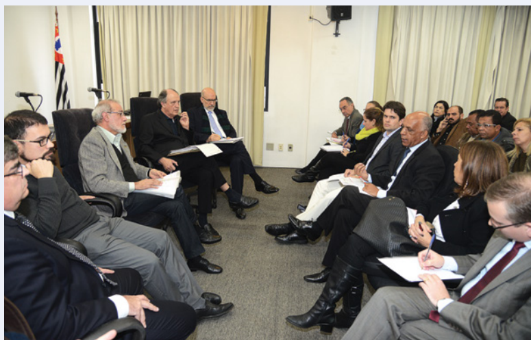
> Promotoria da saúde reúne os diversos setores para discutir alternativas